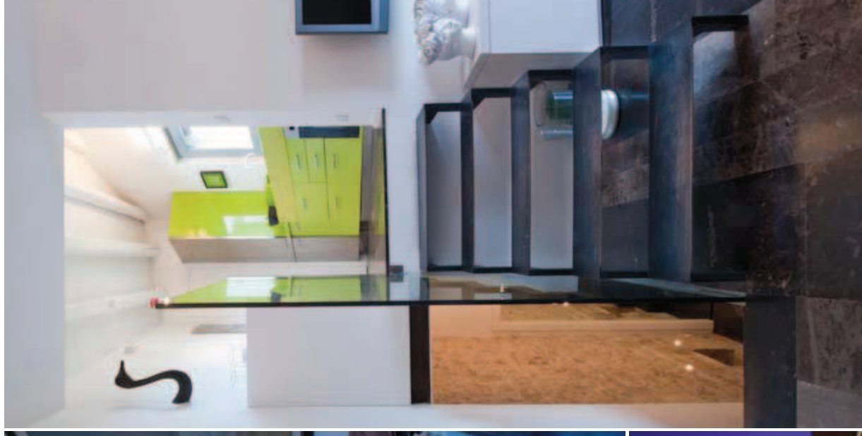
LA CUCINA VERDE ACIDO IN CORIAN È RICAVATA INTERAMENTE REALIZZATA SU PROGETTO NELLA TERRAZZA ADIACENTE LA SOTTILE SCALA IN FERRO NERO NATURALE TRATTATO CON UNA PATINA SILCONICA È RICAVATA IN UNO STRETTO VANO AD ANGOLO CHE SI AFFACCIA SUL LIVING